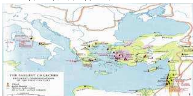
நண்பர் சுவிசேஷ ஜெயக்குழு

அப்போஸ்தலர் எல்லோரினும் மிகச் சிறியவர் என்று தன்னை அழைத்துக்கொண்ட பவுல், எருசலேம் தொடங்கி, நவீன க்ரோஷுவியாவில் உள்ள இல்லிரிக்கம் வரை மத்தியதரைக் கடல் சார்ந்த பிராந்தியத்தில் நற்செய்தியைப் பரப்பினார். பேரரசர்